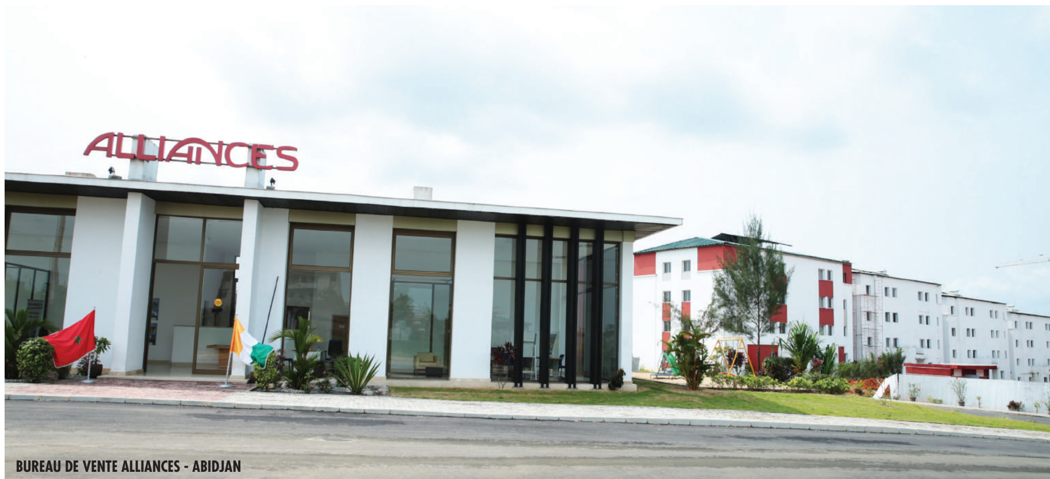
BUREAU DE VENTE ALLIANCES - ABIDJAN